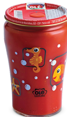
MOLHO DE TOMATE DECORADO 260 G

Código do Produto: 1556 Shelf Life: 36 meses Bandeja com 12 unidades EAN-13: 789 1032 01555 0 DUN-14: 2 789 1032 01555 4