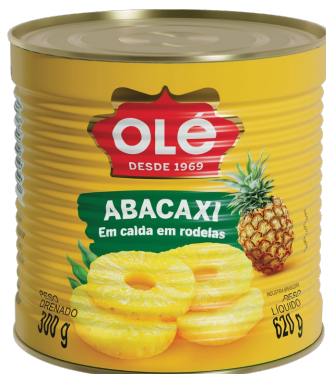
ABACAXI EM CALDA 300 G

Código do Produto: 1662 Shelf Life: 36 meses Caixa com 12 unidades EAN-13: 789 1032 01662 5 DUN-14: 2 789 1032 01662 9