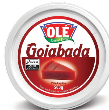
GOIABADA 500 G

Código do Produto: 1805 Shelf Life: 36 meses Bandeja 12 unidades EAN-13: 789 1032 01805 6 DUN-14: 2 789 1032 01805 0