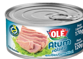
ATUM SÓLIDO 170 G

Código do Produto: 1390 Shelf Life: 48 meses Caixa com 24 unidades EAN-13: 789 1032 01390 7 DUN-14: 3 789 1032 01390 8