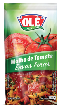
MOLHO DE TOMATE ERVAS FINAS 300 G

Código do Produto: 1463 Shelf Life: 24 meses Caixa com 32 unidades EAN-13: 789 1032 01463 8 DUN-14: 6 789 1032 01463 0