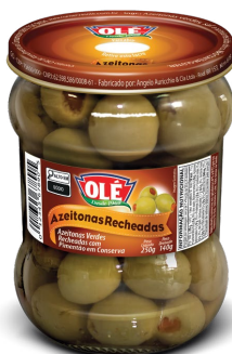
AZEITONAS VERDES RECHEADAS 140 G

Código do Produto: 1436 Shelf Life: 36 meses Bandeja 12 unidades EAN-13: 789 1032 01436 2 DUN-14: 2 789 1032 01436 6