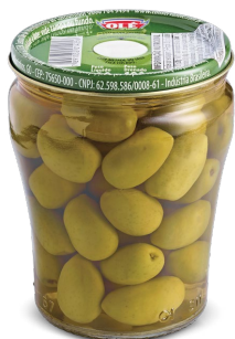
AZEITONAS VERDES 100 G

Código do Produto: 1426 Shelf Life: 36 meses Bandeja 12 unidades EAN-13: 789 1032 01425 6 DUN-14: 2 789 1032 01425 0