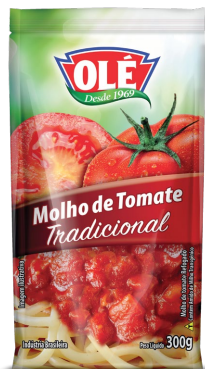
MOLHO DE TOMATE TRADICIONAL 300 G

Código do Produto: 1462 Shelf Life: 24 meses Caixa com 32 unidades EAN-13: 789 1032 01462 1 DUN-14: 6 789 1032 01462 3