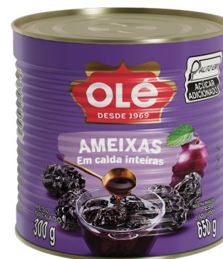
AMEIXAS EM CALDA 300 G

Código do Produto: 1696 Shelf Life: 36 meses Bandeja com 12 unidades EAN-13: 789 1032 01696 0 DUN-14: 2 789 1032 01696 4