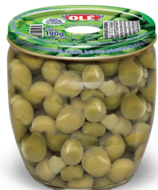
ERVILHA 120 G

Código do Produto: 1325 Shelf Life: 36 meses Bandeja com 12 unidades EAN-13: 789 1032 01325 9 DUN-14: 2 789 1032 01325 3