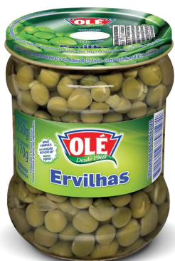
ERVILHA 170 G

Código do Produto: 1235 Shelf Life: 36 meses Bandeja com 12 unidades EAN-13: 789 1032 01235 1 DUN-14: 2 789 1032 01235 5