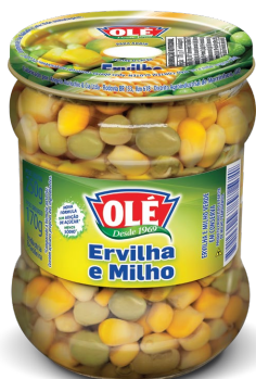
ERVILHA e MILHO 170 G

Código do Produto: 1265 Shelf Life: 36 meses Bandeja com 12 unidades EAN-13: 789 1032 01265 8 DUN-14: 2 789 1032 01265 2