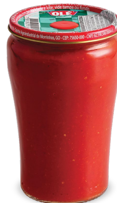
EXTRATO DE TOMATE 260 G

Código do Produto: 1551 Shelf Life: 36 meses Bandeja com 12 unidades EAN-13: 789 1032 01550 5 DUN-14: 2 789 1032 01550 9