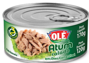
ATUM RALADO 170 G