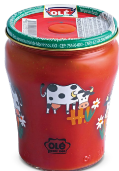
EXTRATO DE TOMATE DECORADO 190 G

Código do Produto: 1561 Shelf Life: 36 meses Bandeja com 12 unidades EAN-13: 789 1032 01560 4 DUN-14: 2 789 1032 01560 8