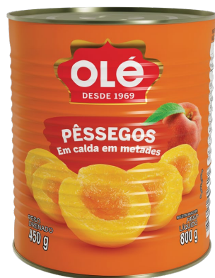
PÊSSEGO EM CALDAS 450 G

Código do Produto: 1610 Shelf Life: 36 meses Caixa com 12 unidades EAN-13: 789 1032 01610 6 DUN-14: 2 789 1032 01610 0