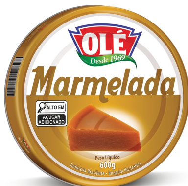
MARMELADA 600 G

Código do Produto: 1835 Shelf Life: 36 meses Caixa com 12 unidades EAN-13: 789 1032 01835 3 DUN-14: 2 789 1032 01830 2