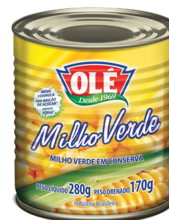
MILHO VERDE 170 G

Código do Produto: 1220 Shelf Life: 36 meses Bandeja com 24 unidades EAN-13: 789 1032 01220 7 DUN-14: 3 789 1032 01220 8