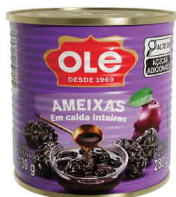
AMEIXAS EM CALDA 130 G

Código do Produto: 1710 Shelf Life: 36 meses Bandeja com 12 unidades EAN-13: 789 1032 01710 3 DUN-14: 2 789 1032 01710 7