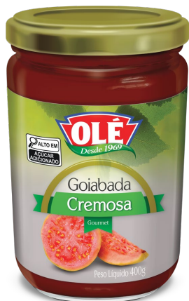
GOIABADA CREMOUSA 400 G

Código do Produto: 1805 Shelf Life: 36 meses Bandeja 12 unidades EAN-13: 789 1032 01805 6 DUN-14: 2 789 1032 01805 0