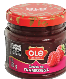
GELEIA DE FRAMBOEJA POTE 160G

Cód.Produto: 1933 Shelf Life: 36 meses Bandeja com 12 unidades EAN-13 : 789 1032 01933 6 DUN-14 : 2 789 1032 01933 0