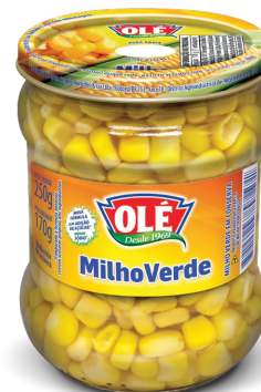
MILHO VERDE 170 G

Código do Produto: 1235 Shelf Life: 36 meses Bandeja com 12 unidades EAN-13: 789 1032 01235 1 DUN-14: 2 789 1032 01235 5