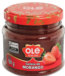
GELEIA DE MORANGO POTE 160G

Código do Produto: 1913 Shelf Life: 36 meses Bandeja com 12 unidades EAN-13: 789 1032 01913 8 DUN-14: 2 789 1032 01913 2