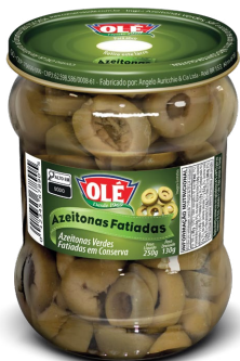
AZEITONAS FATIADAS 130 G

Código do Produto: 1436 Shelf Life: 36 meses Bandeja 12 unidades EAN-13: 789 1032 01436 2 DUN-14: 2 789 1032 01436 6