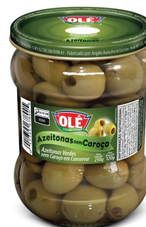
AZEITONAS SEM CAROÇO 120 G

Código do Produto: 1434 Shelf Life: 36 meses Bandeja 12 unidades EAN-13: 789 1032 01434 8 DUN-14: 2 789 1032 01434 2