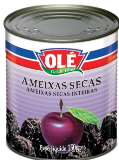
AMEIXAS SECAS 150 G

Código do Produto: 1726 Shelf Life: 36 meses Bandeja com 12 unidades EAN-13: 789 1032 01726 4 DUN-14: 2 789 1032 01726 8