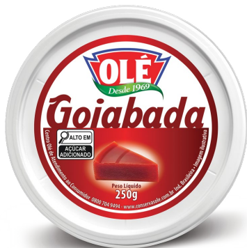
GOIABADA 250 G

Código do Produto: 1812 Shelf Life: 24 meses Caixa com 24 unidades EAN-13: 789 1032 01812 4 DUN-14: 3 789 1032 01812 5