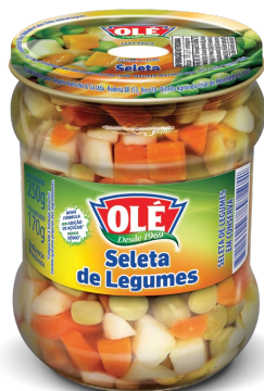
SELETA DE LEGUMES 170 G

Código do Produto: 1265 Shelf Life: 36 meses Bandeja com 12 unidades EAN-13: 789 1032 01265 8 DUN-14: 2 789 1032 01265 2