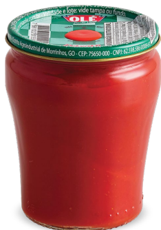
EXTRATO DE TOMATE 190 G