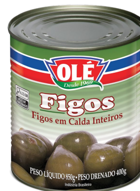
FIGO EM CALDAS 400 G

Código do Produto: 1610 Shelf Life: 36 meses Caixa com 12 unidades EAN-13: 789 1032 01610 6 DUN-14: 2 789 1032 01610 0