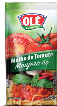
MOLHO DE TOMATE MANJERICÃO 300 G

Código do Produto: 1462 Shelf Life: 24 meses Caixa com 32 unidades EAN-13: 789 1032 01462 1 DUN-14: 6 789 1032 01462 3