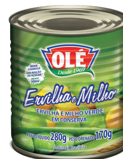
ERVILHA E MILHO 170 G

Código do Produto: 1250 Shelf Life: 36 meses Bandeja com 24 unidades EAN-13: 789 1032 01250 4 DUN-14: 3 789 1032 01250 5