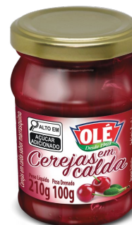
CEREJA EM CALDA 100 G

Código do Produto: 1662 Shelf Life: 36 meses Caixa com 12 unidades EAN-13: 789 1032 01662 5 DUN-14: 2 789 1032 01662 9