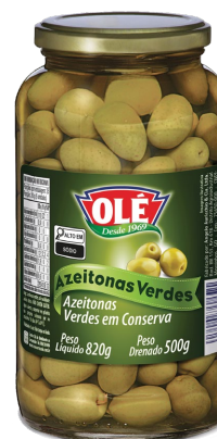
AZEITONAS VERDES 500 G

Código do Produto: 1437 Shelf Life: 36 meses Bandeja 12 unidades EAN-13: 789 1032 01437 9 DUN-14: 2 789 1032 01437 3