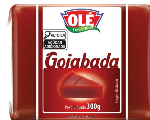
GOIABADA FLOW PACK 300 G

Código do Produto: 1821 Shelf Life: 24 meses Caixa com 24 unidades EAN-13: 789 1032 01821 6 DUN-14: 3 789 1032 01821 7