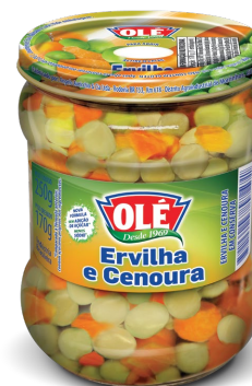
ERVILHA e CENOURA 170 G

Código do Produto: 1340 Shelf Life: 36 meses Bandeja com 12 unidades EAN-13: 789 1032 01340 2 DUN-14: 2 789 1032 01340 6