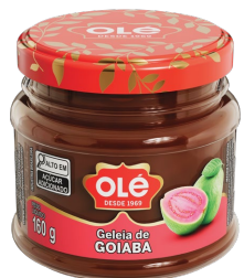
GELEIA DE GOIABA POTE 160G

Cód.Produto: 1923 Shelf Life: 36 meses Bandeja com 12 unidades EAN-13 : 789 1032 01923 7 DUN-14 : 2 789 1032 01923 1