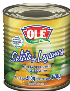
SELETA DE LEGUMES 170 G

Código do Produto: 1310 Shelf Life: 36 meses Bandeja com 24 unidades EAN-13: 789 1032 01310 5 DUN-14: 3 789 1032 01310 6