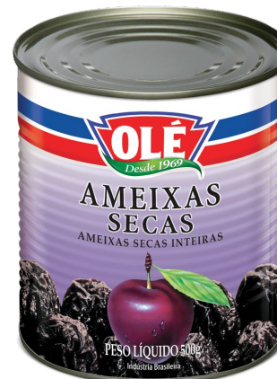
AMEIXAS SECAS 500 G

Código do Produto: 1726 Shelf Life: 36 meses Bandeja com 12 unidades EAN-13: 789 1032 01726 4 DUN-14: 2 789 1032 01726 8