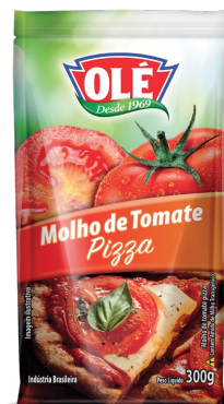
MOLHO DE TOMATE PIZZA 300 G

Código do Produto: 1464 Shelf Life: 24 meses Caixa com 32 unidades EAN-13: 789 1032 01464 5 DUN-14: 6 789 1032 01464 7