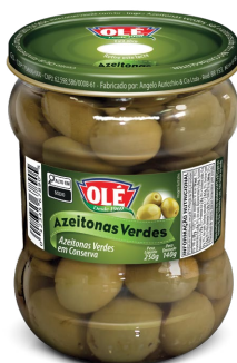
AZEITONAS VERDES 140G

Código do Produto: 1426 Shelf Life: 36 meses Bandeja 12 unidades EAN-13: 789 1032 01425 6 DUN-14: 2 789 1032 01425 0