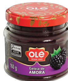
GELEIA DE AMORA POTE 160G

Cód.Produto: 1943 Shelf Life: 36 meses Bandeja com 12 unidades EAN-13 : 789 1032 01943 5 DUN-14 : 2 789 1032 01943 9