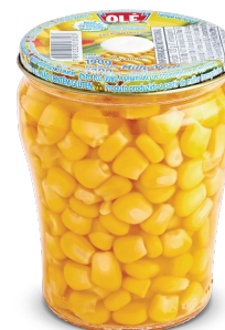
MILHO VERDE 120G

Código do Produto: 1240 Shelf Life: 36 meses Bandeja com 12 unidades EAN-13: 789 1032 01240 5 DUN-14: 2 789 1032 01240 9