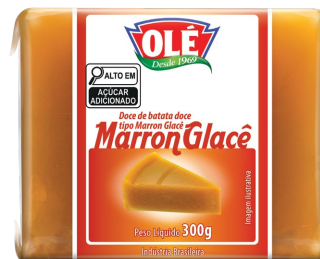
MARRON GLACÊ FLOW PACK 300 G

Código do Produto: 1835 Shelf Life: 36 meses Caixa com 12 unidades EAN-13: 789 1032 01835 3 DUN-14: 2 789 1032 01830 2