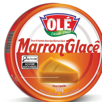
MARRON GLACÊ 600 G

Código do Produto: 1841 Shelf Life: 24 meses Caixa com 24 unidades EAN-13: 789 1032 01841 4 DUN-14: 3 789 1032 01841 5