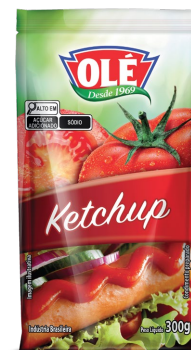
KETCHUP SACHÊ 300G

Código do Produto: 1597 Shelf Life: 24 meses Caixa com 24 unidades EAN-13: 789 1032 01597 0 DUN-14: 3 789 1032 01597 1