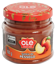
GELEIA DE PÊSSEGO POTE 160G

Código do Produto: 1913 Shelf Life: 36 meses Bandeja com 12 unidades EAN-13: 789 1032 01913 8 DUN-14: 2 789 1032 01913 2